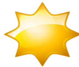
photo à venir