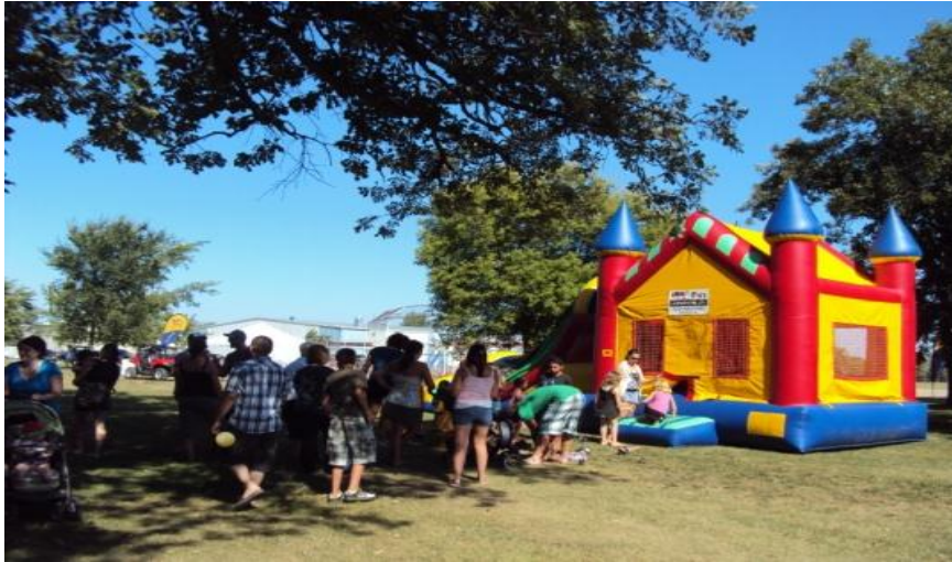
Photo : Bravo aux enfants du voisinage de Notre-Dame-de-Lourdes