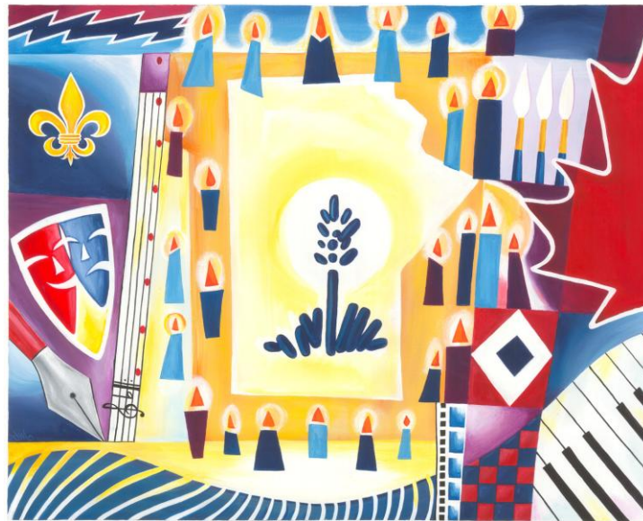
25 ans - La voix culturelle au rural!