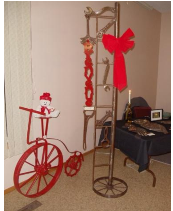
Photo : sculpture, artiste de La Broquerie